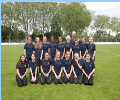
Gefördert: Schulmannschaften Leichtathletik & Rudern