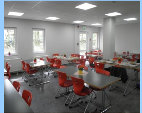
Gefördert: Einrichtung der Schulmensa